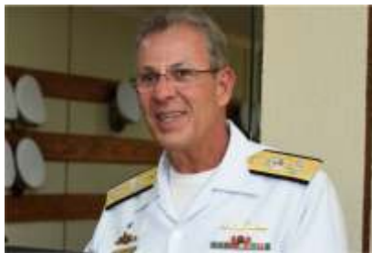
Bento, demitido por seguir política de governo

Ele integra o núcleo de proximidade de Paulo Guedes. Em suas primeiras declarações, avisou que sua prioridade é privatizar a Petrobrás e a Eletrobrás. A Petrobrás obteve um lucro líquido de R$ 44,5 bilhões no primeiro trimestre de 2022 e distribuiu R$ 48,5 bilhões de dividendos para acionistas, dos quais mais da metade ficou com o próprio governo. Privatizada os dividendos deixam de ir para a receita pública e vai todo para a privada.