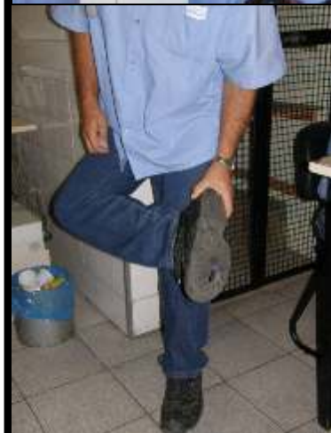
«Meu sapato já furou...»